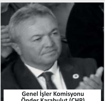
Genel İşler Komisyonu Önder Karabulut (CHP)