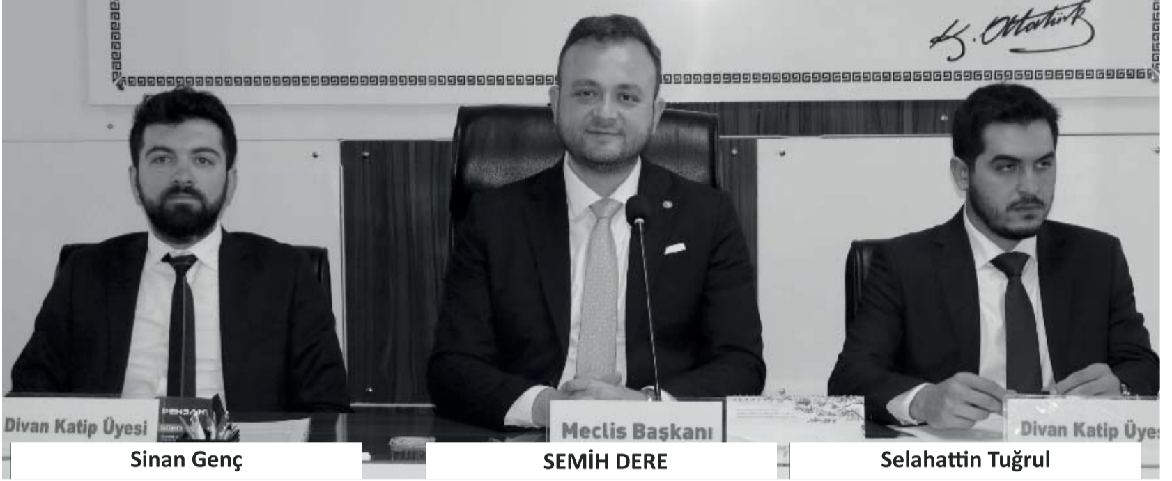
Divan Katip Üyesi

Nisan Ayı meclis toplantısı Komisyon üyelerinin seçiminin ardından 2023 yılı Faaliyet