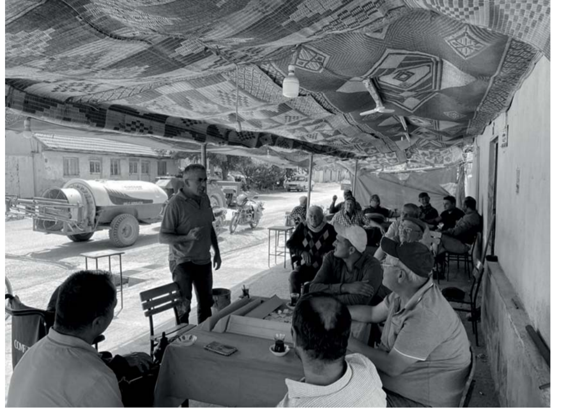
"Anız Yakmak Yeşil Vatan Savunmasına İhanet"

Toplantılarda anız yakmanın fayda değil zarar verdiği belirtilerek "İçerisinde bulunduğumuz hasat döneminde ülkemiz orman yangınları ile mücadele etmektedir. Anız yakmanın herhangi bir faydası olmamakla birlikte özellikle toprağımız ve yeşil vatanımız için önemli bir tehdit unsuru oluşturmaktadır.