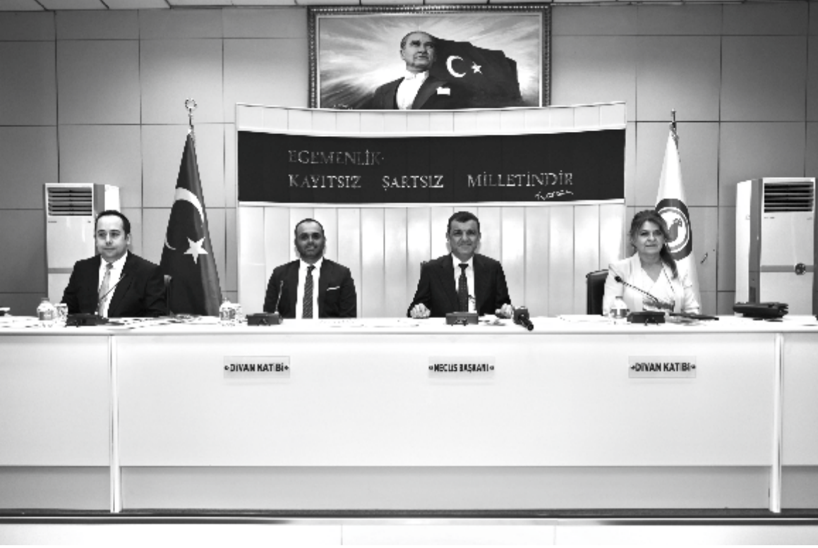
Sosyal belediyeçilik projeleriyle örnek olmaya devam eden Denizli Büyükşehir Belediyesi, kentte

belirlenecek pilot okullarda eğitim alan ilkokul birinci sınıf öğrencilerine beslenme desteği verecek.