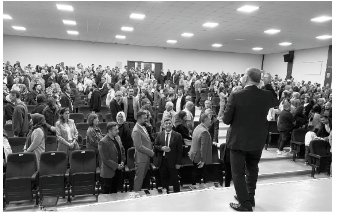
ve idarecilerin maarif modeli hakkında sorularının yanıtlanmasının ardından sona erdi.