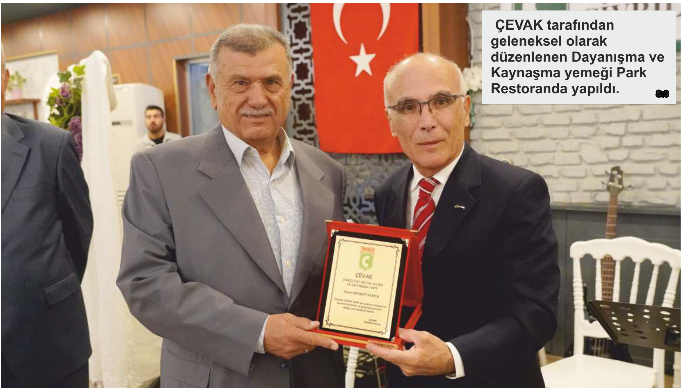
ÇEVAK tarafından geleneksel olarak düzenlenen Dayanışma ve Kaynaşma yemeği Park Restoranda yapıldı.

Çivrililer Eğitim Vakfı (ÇEVAK) yönetimi, geleneksel hale getirdiği tanışma ve kaynaşma yemeğinde Çivrilili hayırseverlerle bir araya geldi