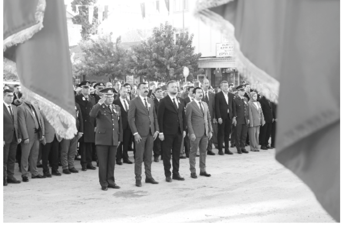
olmak üzere Siyasi parti temsilcileri, Kamu Kurumu müdürleri, STK temsilcileri, öğrenciler ve vatandaşlar Belediye Meclis