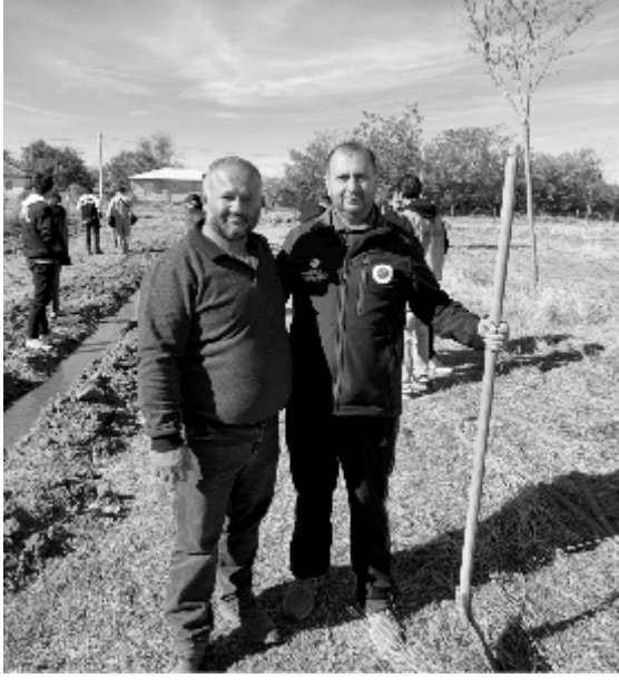
Çivril'de gönüllü gençler "1 İyilik 1 Fidan için adım at Kampanyası"

kapsamında fidanları toprakla buluşturdu. Çivril Müftülüğü, Diyanet İşleri Başkanlığının başlattığı kampanya kapsamında "1 İyilik 1 Fidan" etkinliği düzenledi.