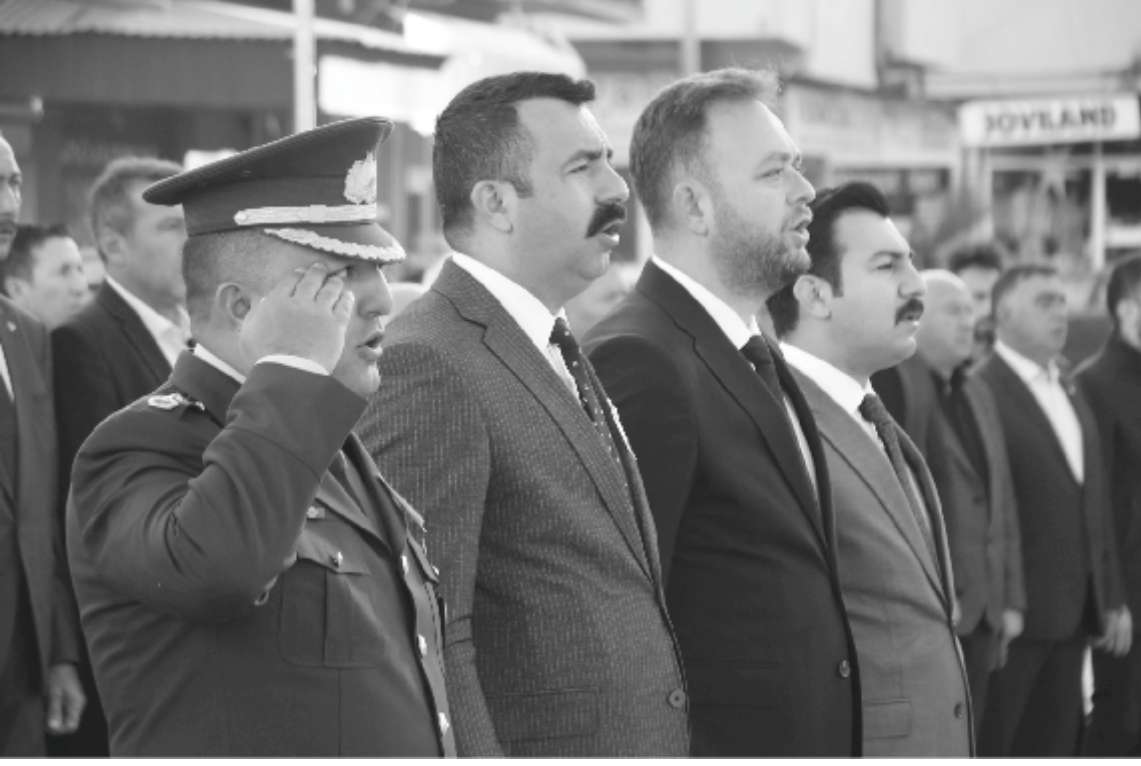
Çivril Kaymakamlığı ve Çivril Belediyesinin önderliğinde hazırlanan anma programı etkinlikleri ile Atatürk'ün aramızdan ayrılışının

Ulu Önder Mustafa Kemal Atatürk'ün aramızdan ayrılışının 86. Yıldönümü, Çivril'de düzenlenen farklı etkinliklerle anıldı