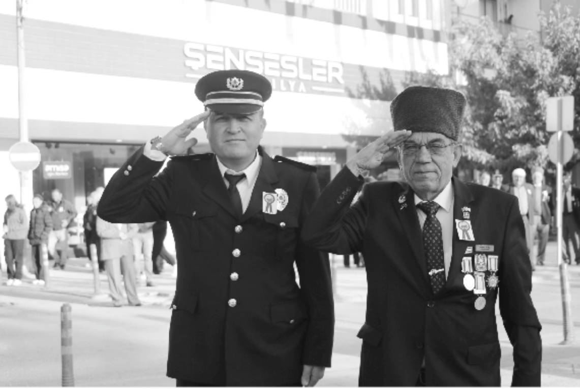
86'ncı yıldönümü programı düzenlendi. 10 Kasım Pazar günü saat 08.55'te Cumhuriyet