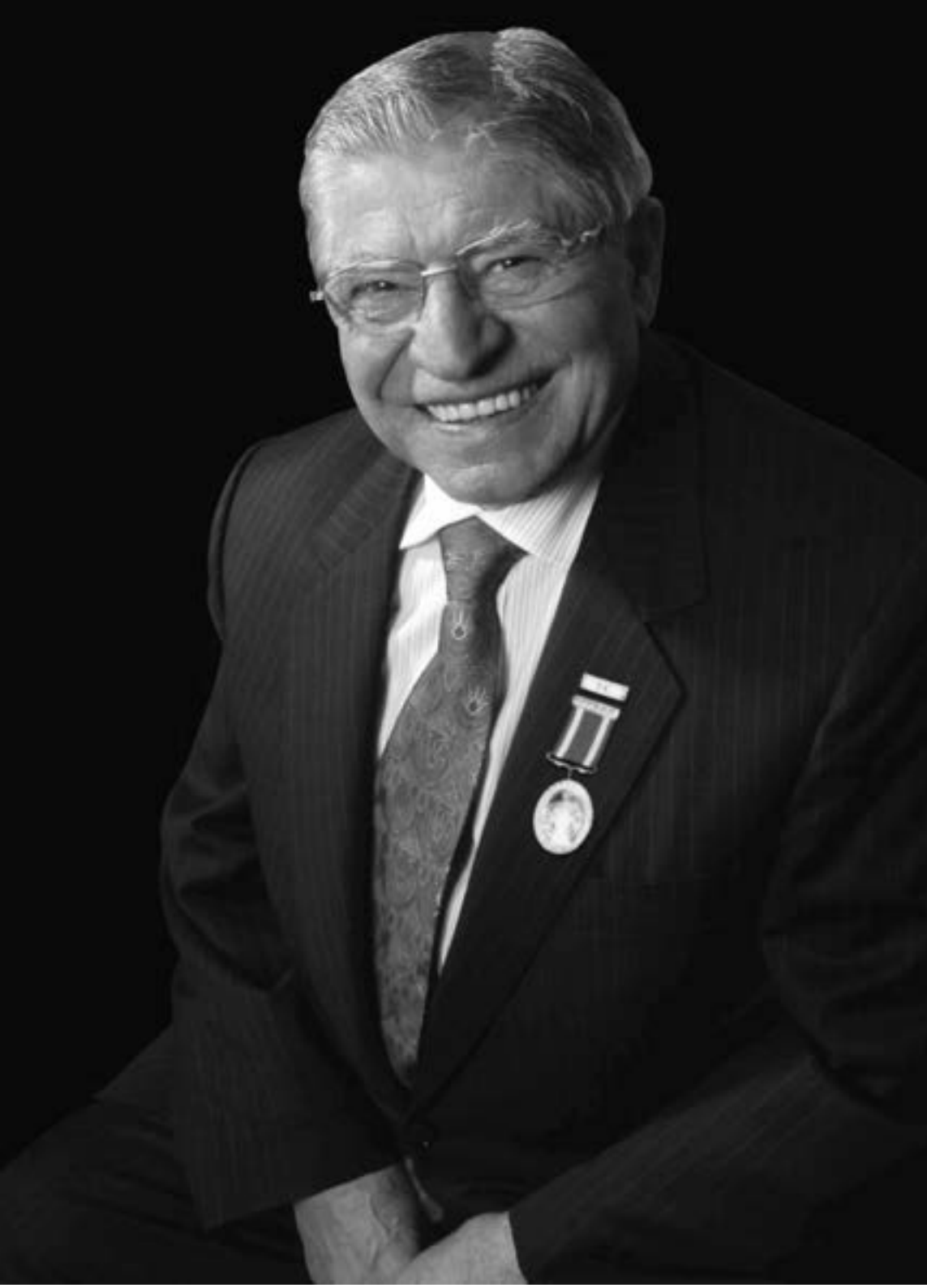
Çivril Dostlar Meclisi'nin kurucusu, kuyumculuk sektörünün önde gelen