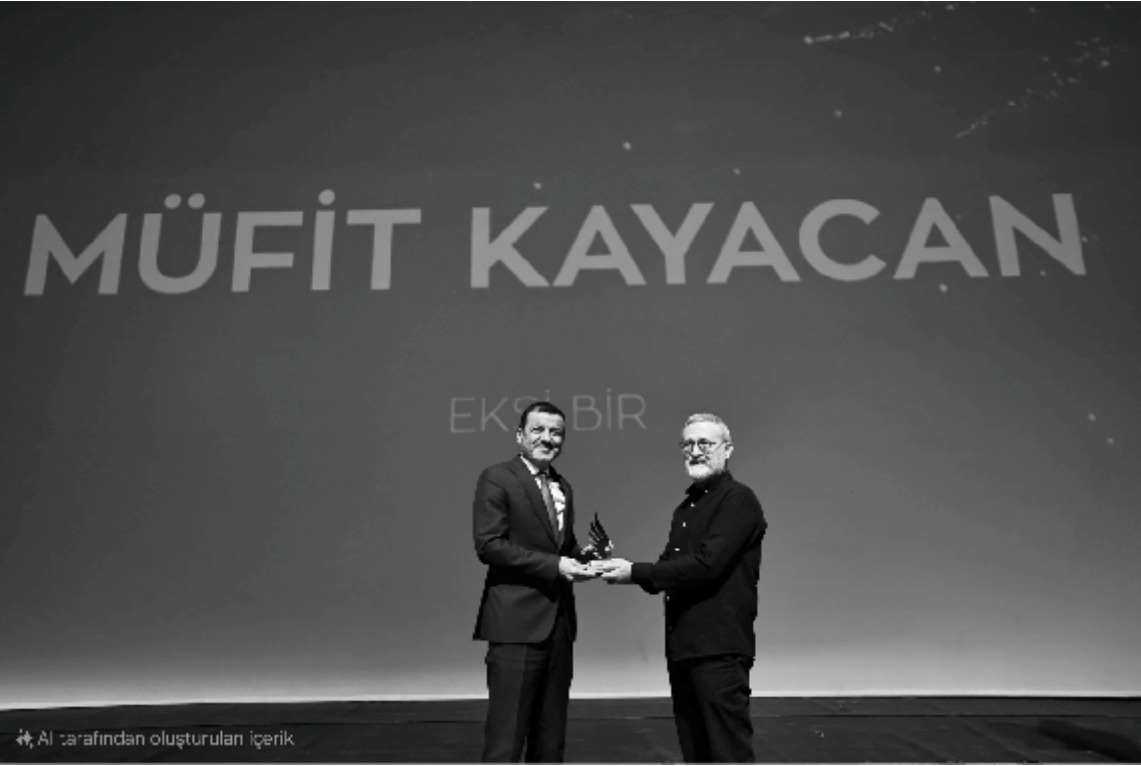
AI tarafından oluşturulan içerik

Denizli Büyükşehir Belediyesinin ilkini düzenlediği Uluslararası Denizli Kısa Film Festivali tüm heyecanı ile sürüyor