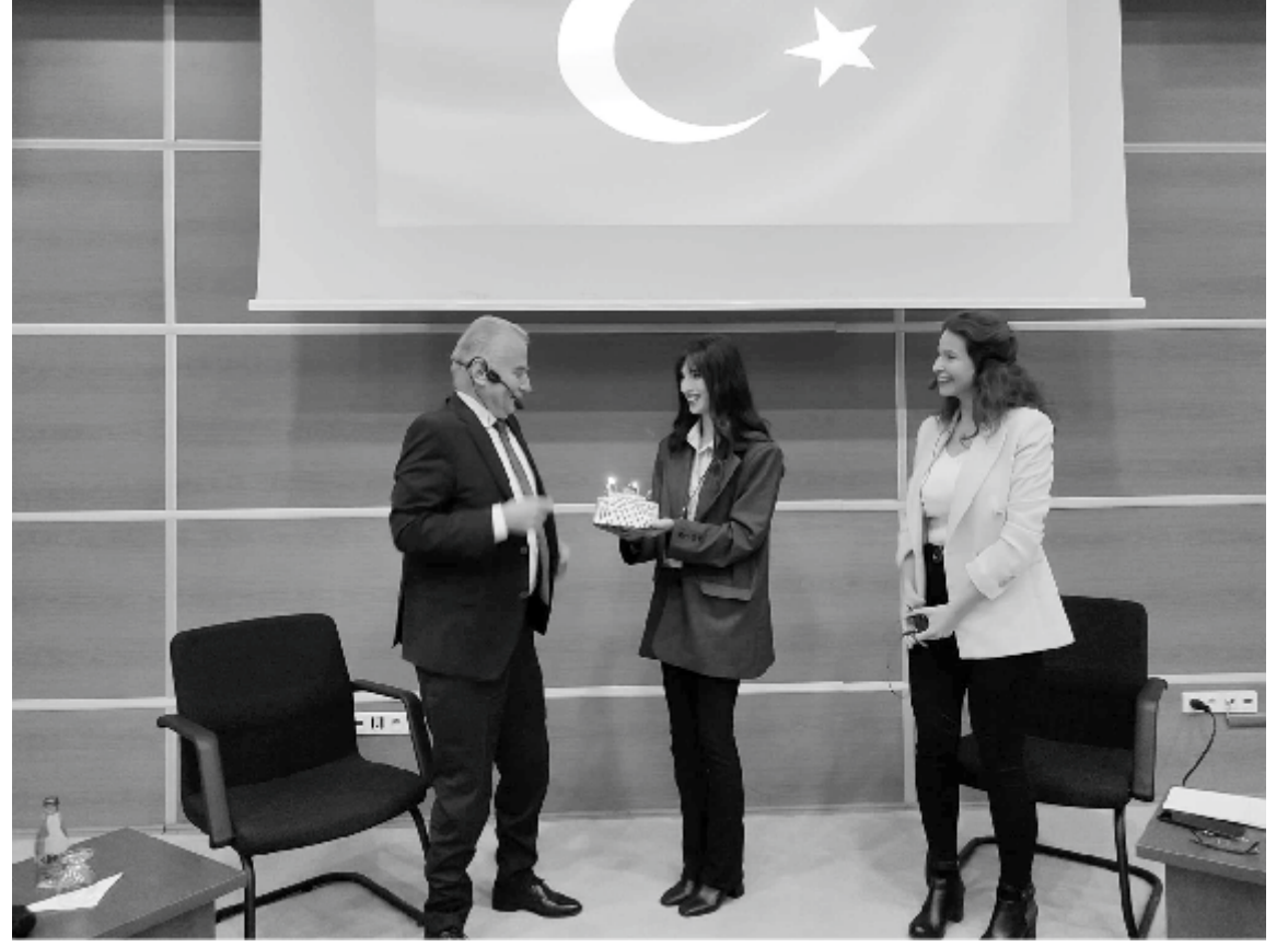
Siyaset Bilimi ve Kamu Yönetimi Topluluğu öğrencilerinin etkinliğe dair hazırladıkları anı