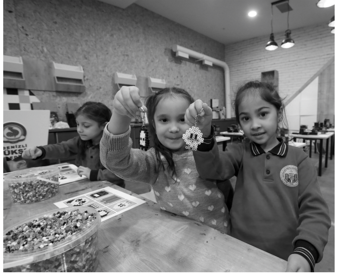
görenbirinci sınıftan dördüncü sınıfkadar