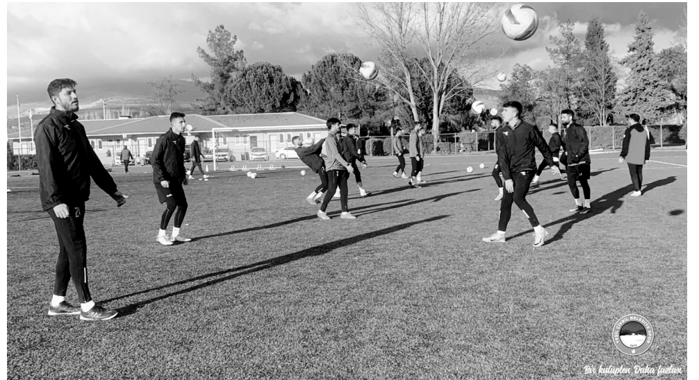
BK Gazetesi - Pazar Gazetesi

Yeşil Çivril Belediye spor 19 Ocak'ta başlayacak ligin ikinci yarısının ilk maçında evinde Bölgesel Amatör Lig'in diğer Denizli temsilcisi Sarayköyspor'u ağırlayacak. // Bülent Çakır