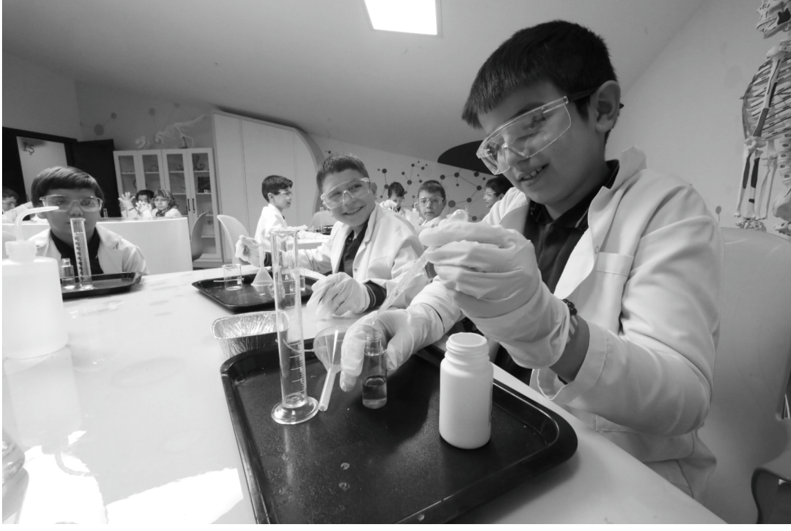
Denizli Bilim Merkezi, köy okullarında eğitim