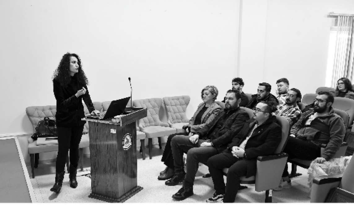
Farklı kurumlardan gelen veteriner hekimlerin eğitim verdiği program sonucu

Denizli Büyükşehir Belediyesi, ev hayvanı satışı yapanlara yönelik bir eğitim programı gerçekleştirdi