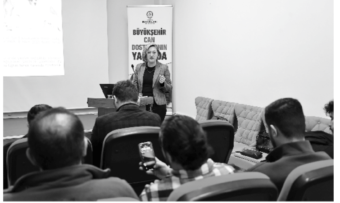
katılımcılara sertifika dağıtıldı. Denizli Büyükşehir Belediyesi Çevre