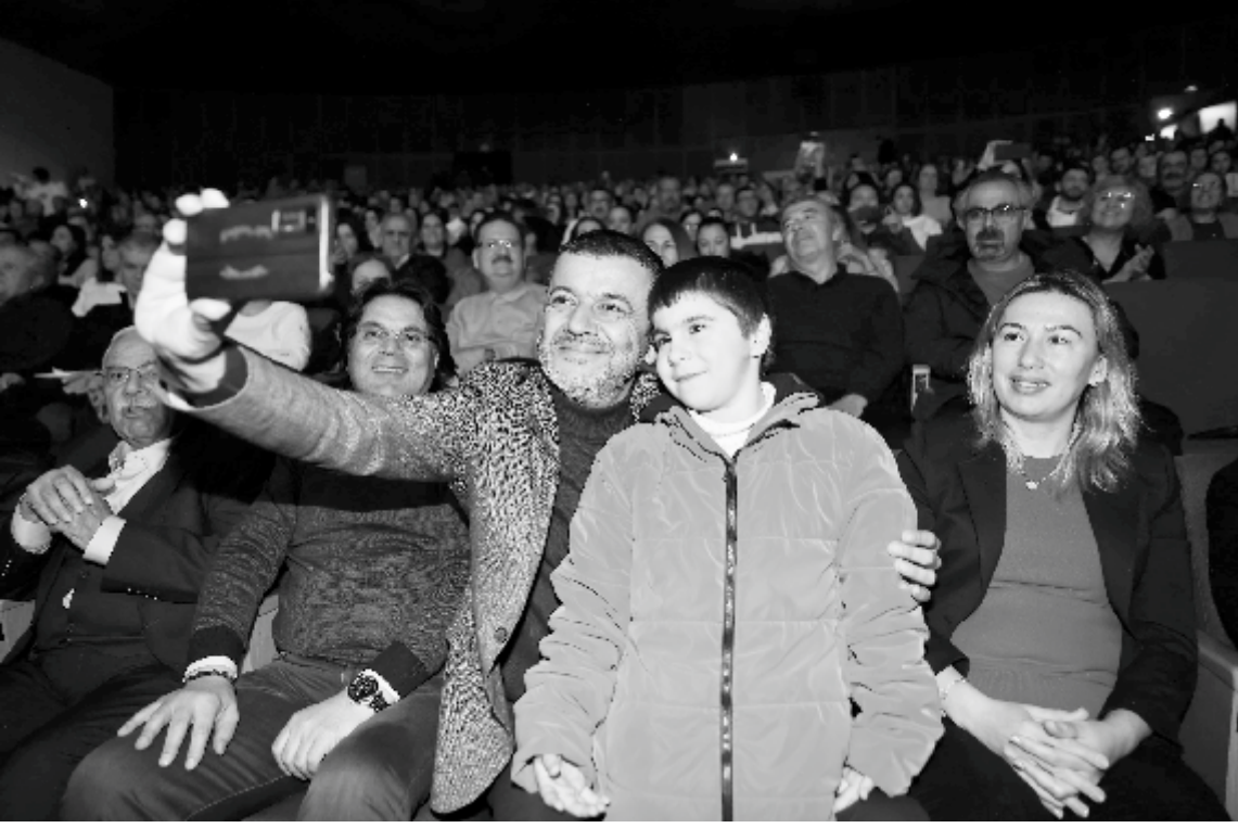
Denizli Büyükşehir Belediyesi tarafından düzenlenen "Urfa Sıra Gecesi" etkinliği, Nihat

Denizli Büyükşehir Belediyesi tarafından "Kültürler Buluşuyor" etkinlikleri kapsamında düzenlenen ve Denizli halkının yoğun ilgi gösterdiği "Urfa Sıra Gecesi" unutulmaz anlara sahne oldu