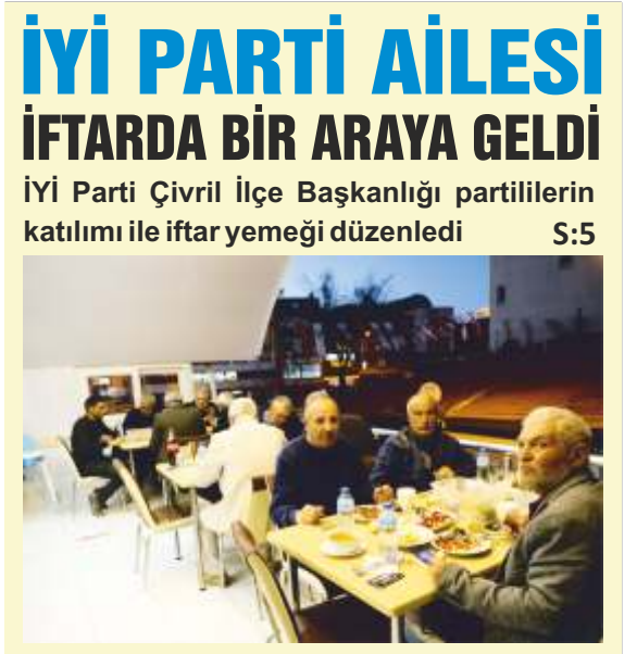
İYİ PARTİ AİLESİ İFTARDA BİR ARAYA GELDİ İYİ Parti Çivril İlçe Başkanlığı partililerin katılımı ile iftar yemeği düzenledi S:5