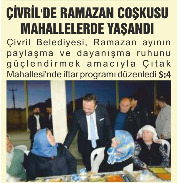
ÇİVRİL'DE RAMAZAN COŞKUSU MAHALLELERDE YAŞANDI Çivril Belediyesi, Ramazan ayının paylaşma ve dayanışma ruhunu güçlendirmek amacıyla Çıtak Mahallesi'nde iftar programı düzenledi S:4