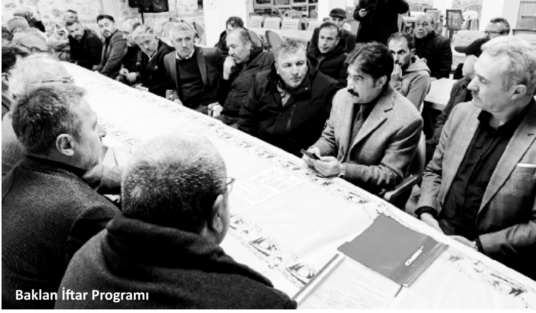
Baklan İftar Programı

Başkanımız da bu konu ile ilgili önemli girişimlerde bulunmuştu vekilimizin de katıldığı bir iftar yemeğinde bir araya gelerek çiftçilerimizin sorun ve beklentilerini tekrar iletmeye şansı yakaladık" dedi.