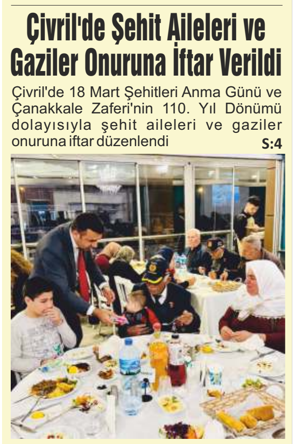
Çivril'de Şehit Aileleri ve Gaziler Onuruna İftar Verildi Çivril'de 18 Mart Şehitleri Anma Günü ve Çanakkale Zaferi'nin 110. Yıl Dönümü dolayısıyla şehit aileleri ve gaziler onuruna iftar düzenlendi S:4