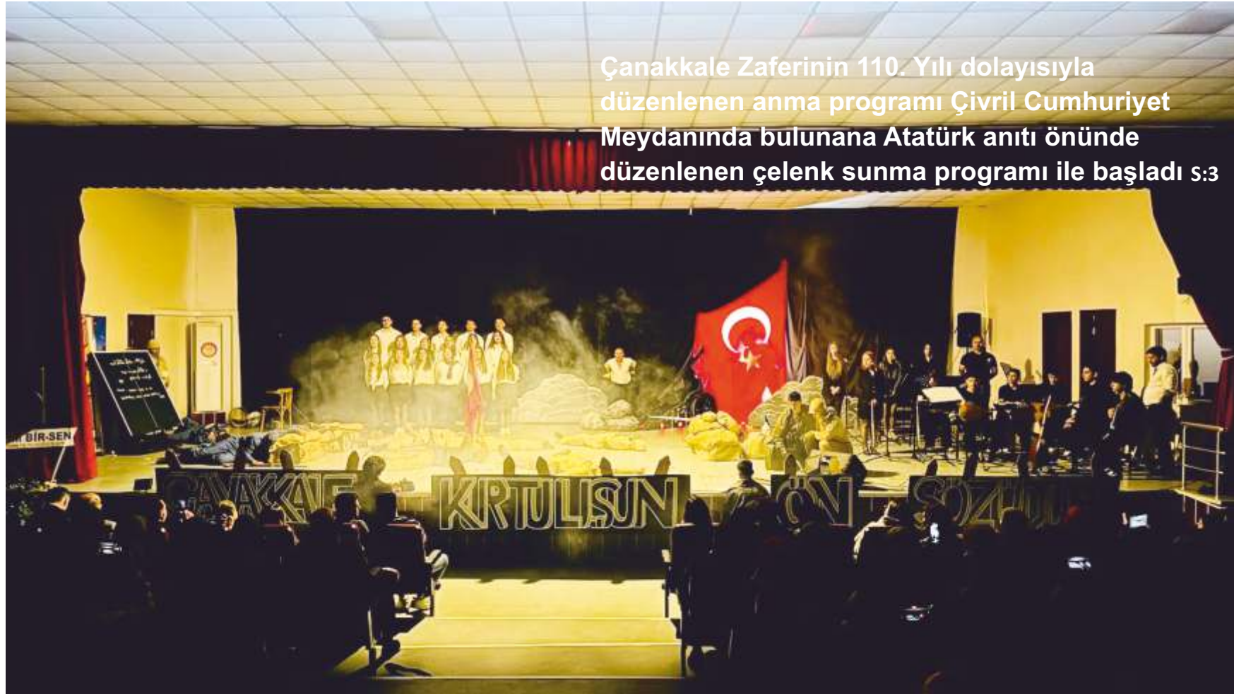
Çanakkale Zaferinin 110. Yılı dolayısıyla düzenlenen anma programı Çivril Cumhuriyet Meydanında bulunana Atatürk anıtı önünde düzenlenen çelenk sunma programı ile başladı s:3

18 Mart Çanakkale Zaferi ve Şehitleri Anma Günü Çivril'de düzenlenen farklı etkinliklerle coşku içinde kutlandı