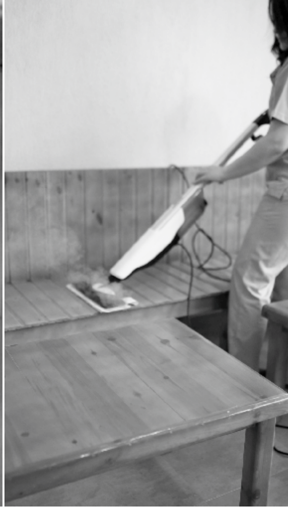
gerçekleştirildiği bildirildi. Çivril Belediyesi'nin sosyal belediyecilik anlayışı çerçevesinde hayata geçirdiği