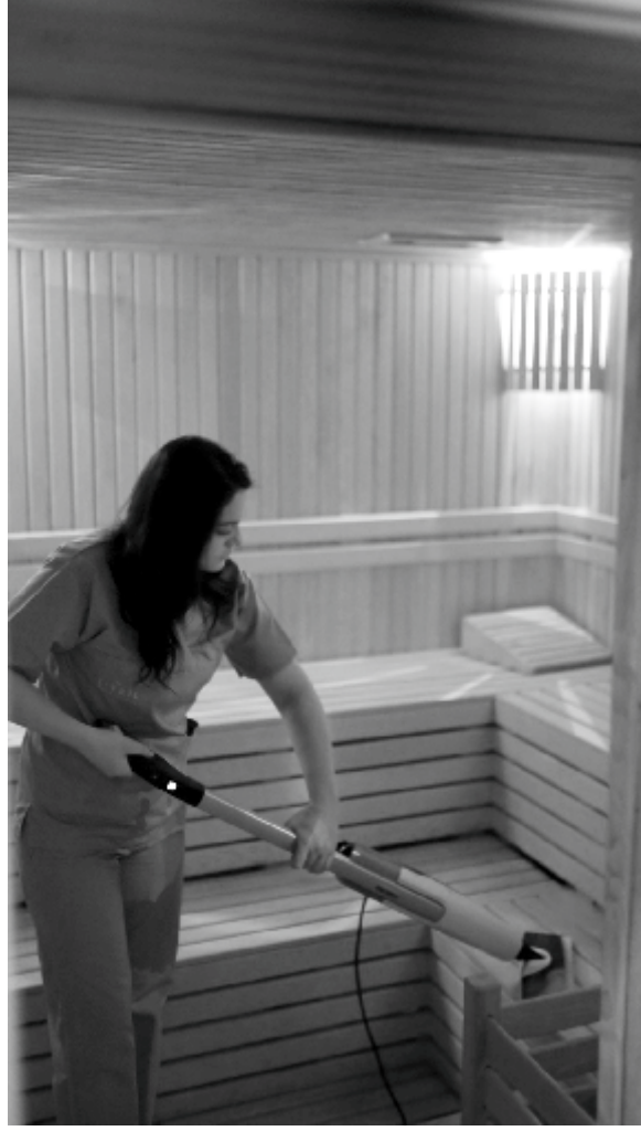
hem günlük hem de haftalık detaylı temizlik planlarının uygulandığı, ayrıca teknik ekipler tarafından düzenli kontrollerin

Belediye açıklamasında, vatandaşların gönül rahatlığıyla hizmet alabilmesi için