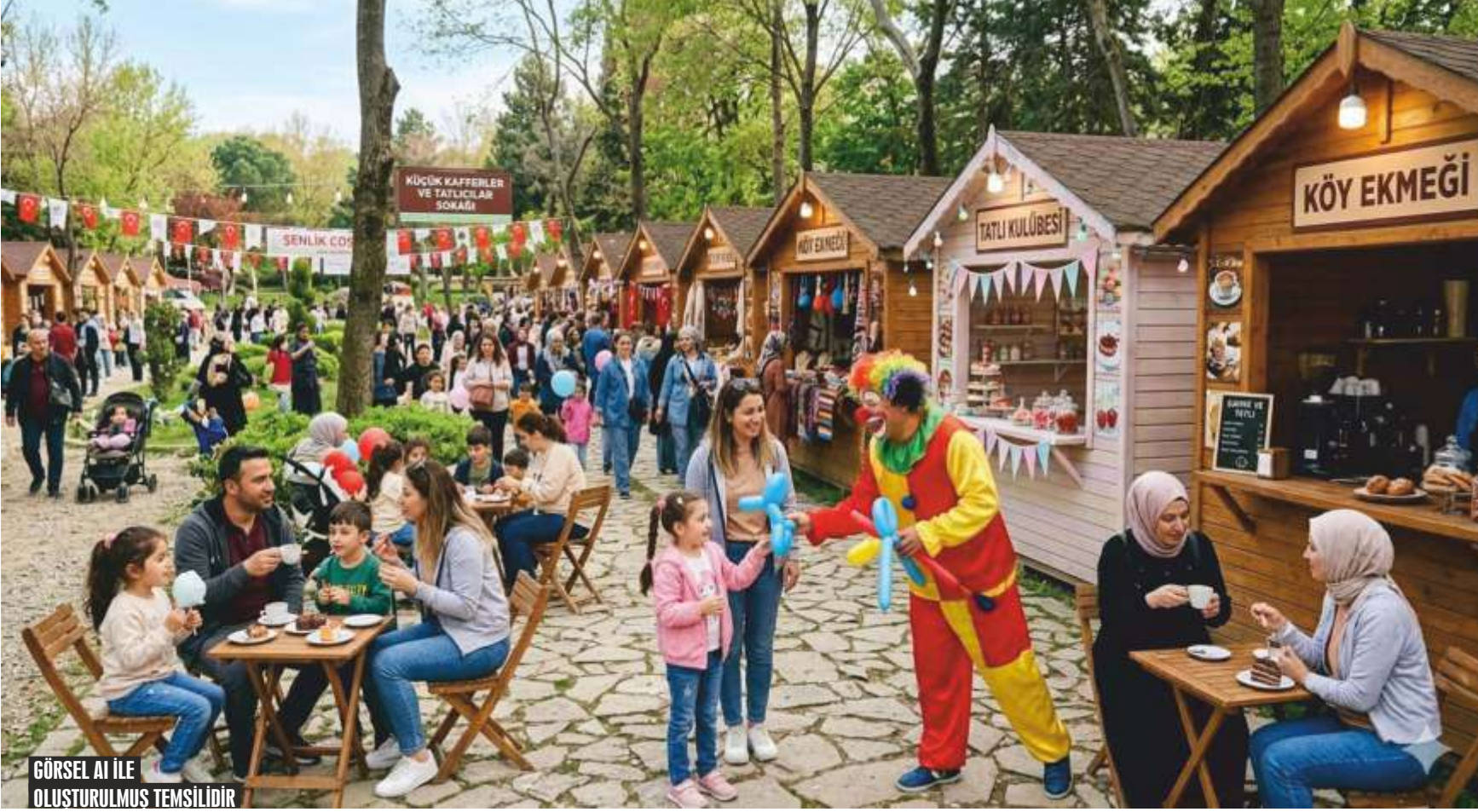
GÖRSEL AI İLE OLUŞTURULMUŞ TEMSİLİDİR

Çivril Belediyesi, Ramazan ayının birlik ve beraberlik ruhunu yaşatmak amacıyla 13-18 Mart tarihleri arasında Cumhuriyet Meydanı'nda düzenleyeceği Ramazan Şenlikleri ile ilçe halkını kültür, sanat ve eğlence dolu etkinliklerde buluşturacak s:3