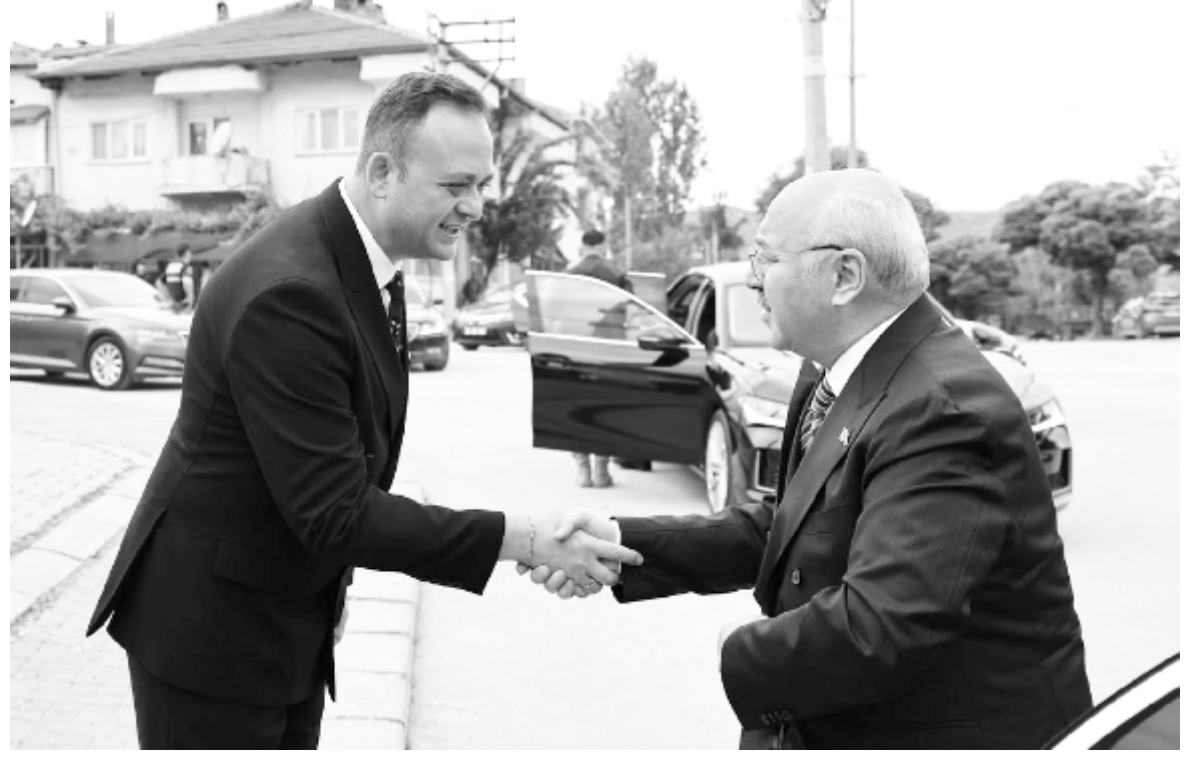
Belediye ziyaretinin neden gerçekleşmediğine ilişkin resmi bir açıklama yapılmazken, programda yer

Vali Yavuz Selim Köşger'in Çivril programında dikkat çeken detay ise belediye ziyareti oldu. Edinilen bilgilere göre ziyaret programında Çivril Belediyesi'nin de yer aldığı ancak gün içerisinde belediyeye herhangi bir ziyaret