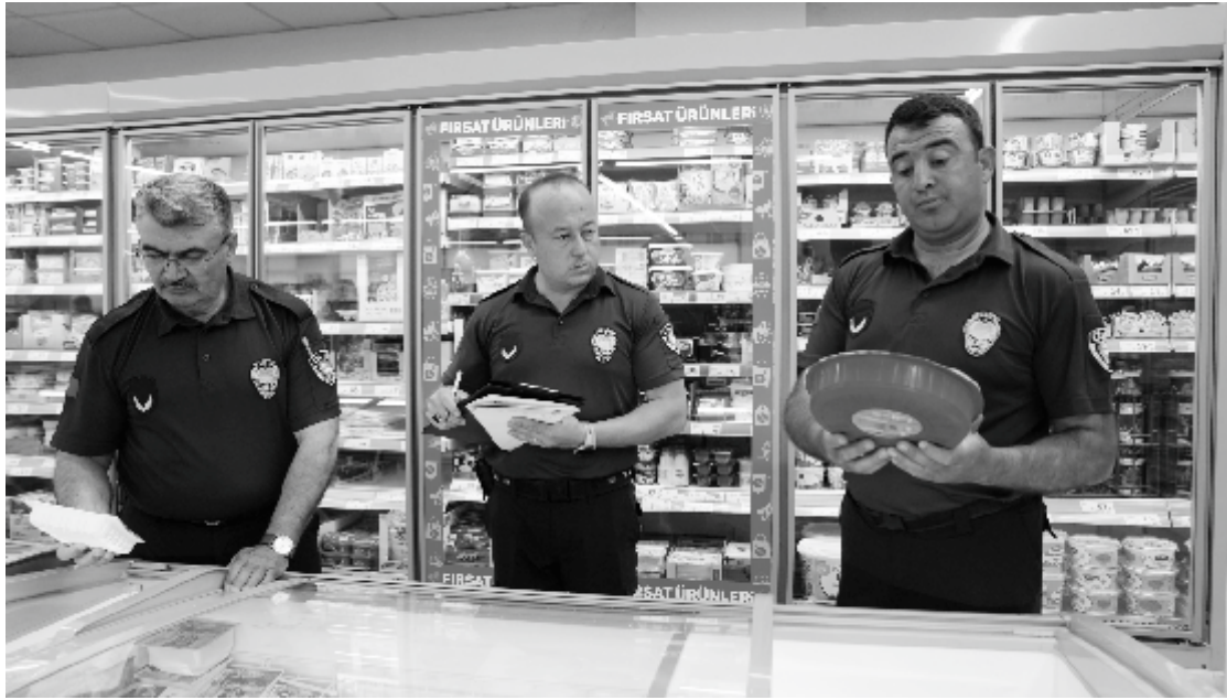
arasındaki uyumu da denetledi. Ayrıca marketlerin genel temizlik ve düzen

Çivril Belediyesi tarafından yürütülen denetimlerde, tüketici haklarının korunması ve halk sağlığının güvence altına alınması hedefleniyor. Ekipler, raflarda bulunan ürünlerin son kullanma tarihlerini kontrol ederken, fiyat etiketi ile kasa fiyatları